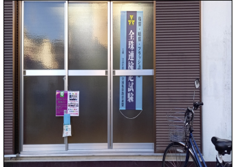
沖町教室教室 座席 26名