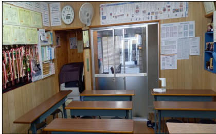
日新教室 座席は26名