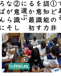
マルタそろばん教室

① どの非 認知能力 を意図す るか最初 に選ぶ ② 意識し ながらそ ろばんに