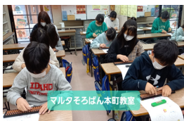
マルタそろばん本町教室

1. 非認知能力ってど んな能力？ 認知能力 は見える 学力(点数 でできる 能力)で ある。非 認知能力