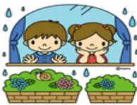
6月度暗算大相撲記録更新者R5.6.18

が他の生徒を指導しているところ、間違いないところ、間違いない女の子に「俺教えるの上手いで」と、いうのでそれならばちよつと教えてあげて、分かったと3年生のお兄さん、1年生の子に間違えた部分を指導してくれました。 私も他の子を指導しながら3年生のお兄さんの指導をみてみると、10の合成も自分の指を出しながら上手く指導しており頼もしく感じました。 1年生の女の子も分かったよう、その後はしっかり集中して弾いていました。お兄さんありがとうございます。